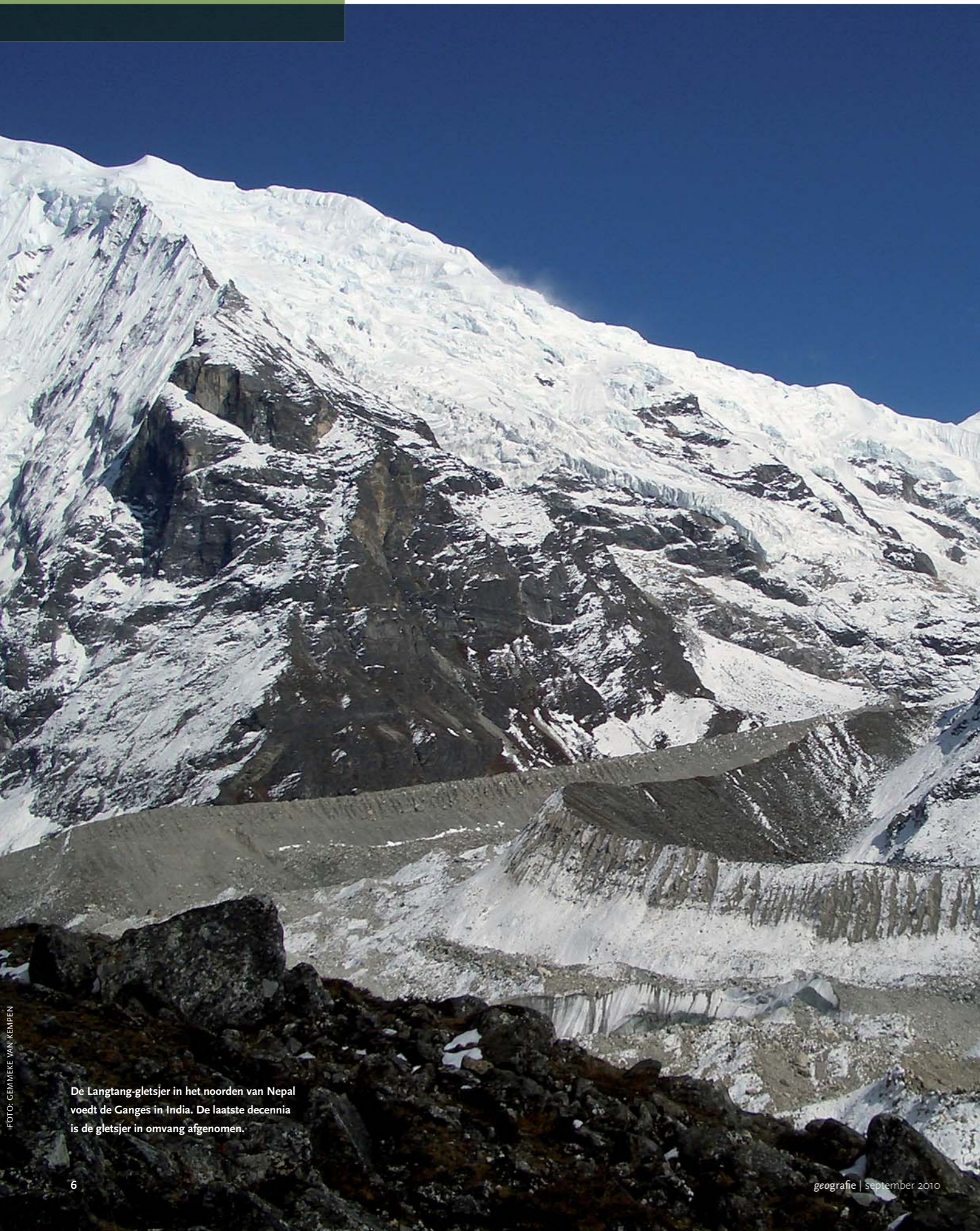
De Langtang-gletsjer in het noorden van Nepal voedt de Ganges in India. De laatste decennia is de gletsjer in omvang afgenomen.

Alle rivieren in Azië worden gevoed door de gletsjers en sneeuwvelden van de Himalaya en het Tibetaanse plateau. Deze 'watertorens' worden bedreigd door opwarming, maar het effect op de waterbeschikbaarheid en voedselzekerheid benedenstrooms varieert sterk. Terwijl de landbouwgebieden langs de Indus en Brahmaputra met grote droogten worden bedreigd, zal het langs de Gele rivier juist natter worden.