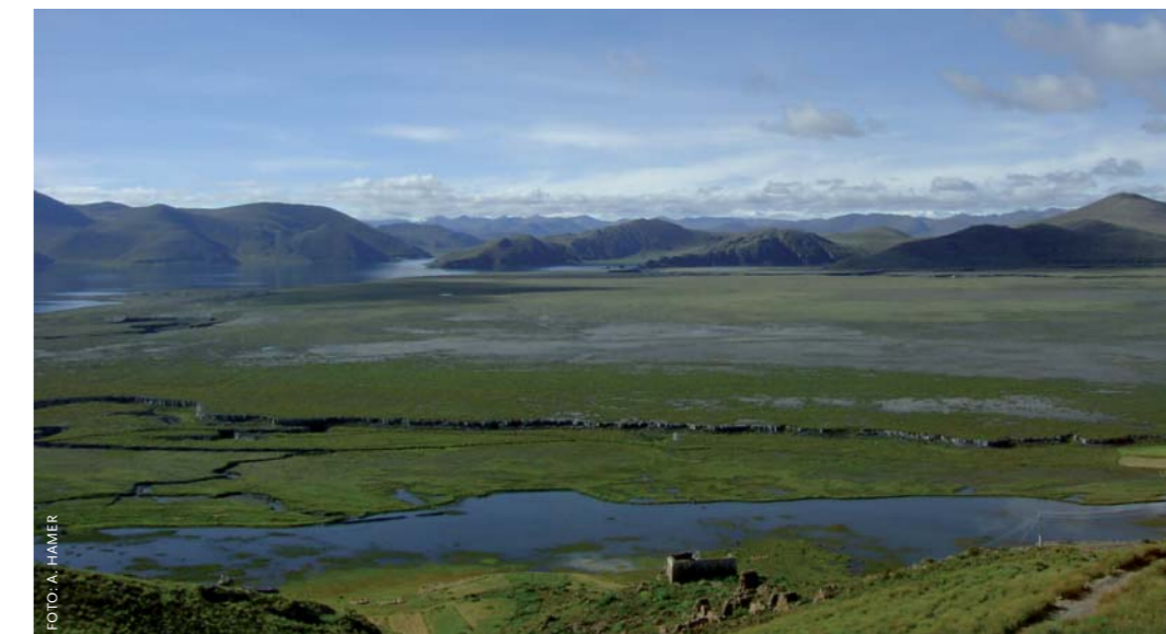
Het Tibetaans plateau in de buurt van Tingri op 4380 meter hoogte. Dit gebied voedt de Brahmaputra die voor 21% afhankelijk is van smeltwater.

Sinds het einde van de laatste ijstijd zijn de meeste gletsjers in de Himalaya aan het slinken. Digitale terreinmodellen en satellietbeelden door de tijd heen tonen een gemid-